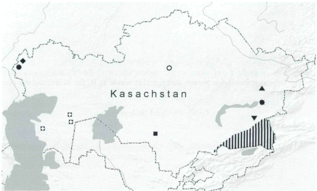
Abb. 1: Fundorte in Kasachstan von Chenopodium gubanovii [○], Atriplex paradoxa [|||||], Atriplex thunbergiaefolia [■], Climacoptera subcrassa und Horaninovia capitata [★], Anabasis ebracteolata [⊠], Glaucium squamigerum [▼], Veronica biloba [●], Ambrosia artemisiifolia und Bidens frondosa [◆], Senecio viscosus [▲].

Auch diese Art ist neu für Kasachstan; sie war bisher nur aus einigen Gebieten von Usbekistan, Turkmenistan und Tadschikistan bekannt [LE, MWG, TASH]. Sie ist typisch für Flussgebüsch (die sogenannten "Tugai") und tritt hin und wieder auch an sekundären Standorten auf.