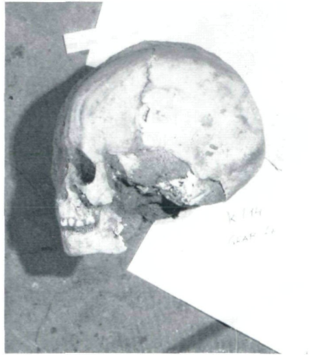
Oben, links: Schädel aus Grab 1, Quadrant A II—k/12. Oben, rechts: Schädel aus Grab 5, Quadrant A II—l/15. Unten, links: Schädel aus Grab 9, Quadrant A II—n/13. Unten, rechts: Schädel aus Grab 4, Quadrant A II—k/14.