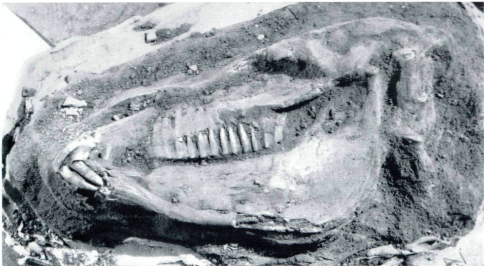
Oben: Skelett aus Grab 10, Quadrant A II—n/13. Unten: Equiden-Bestattung aus Tell ed Dab'a.