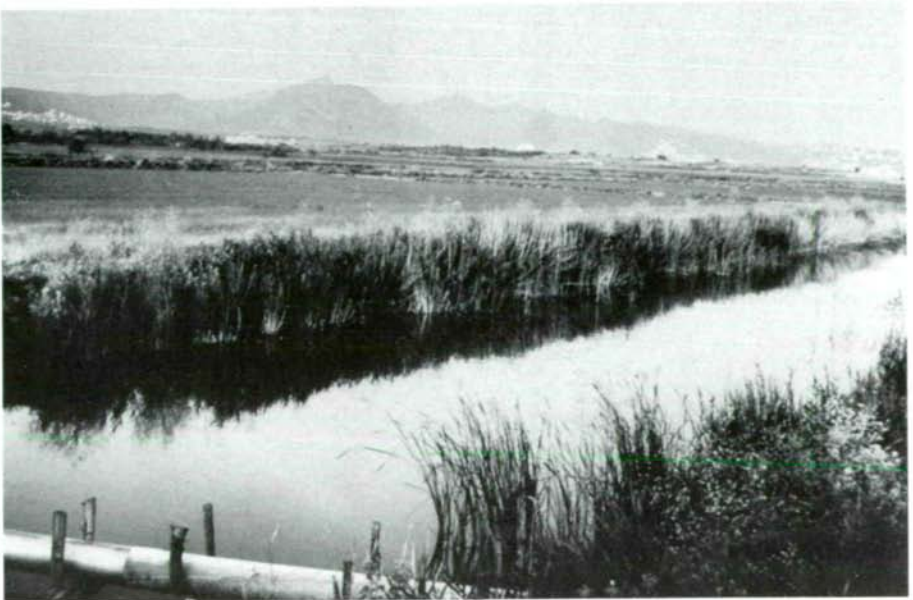
Abb.3 und 4: Flugplatz von Pelosia obtusa pavlasi ssp.n. bei Rosas, Provinz Gerona, Nordspanien. Abb.3 zeigt den humiden Biotop (Leuchtplatz) unmittelbar bei dem in Abb. 4 dargestellten Fluß. Im Hintergrund die Ostpyrenäen.