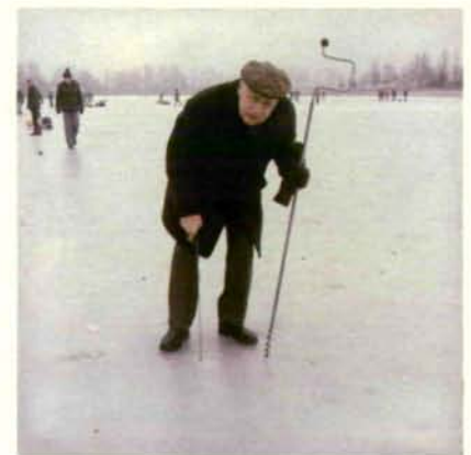
Der Verfasser – „Eisforscher aus Leidenschaft“ – mit seinem „Handwerkzeug“ Eisbohrer und Eisstärkemesser am „Arbeitsplatz“.

Eine Zusammenfassung der seit 1970 vorliegenden Meßergebnisse wird im Naturkundlichen Jahrbuch der Stadt Linz (Bd. 26, 1980) veröffentlicht.