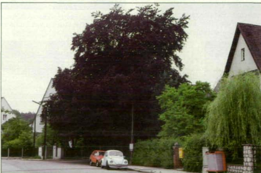
Abb. 1: Diese prächtige Blutbuche in der Niederreithstraße (Linz) steht unter Naturschutz.