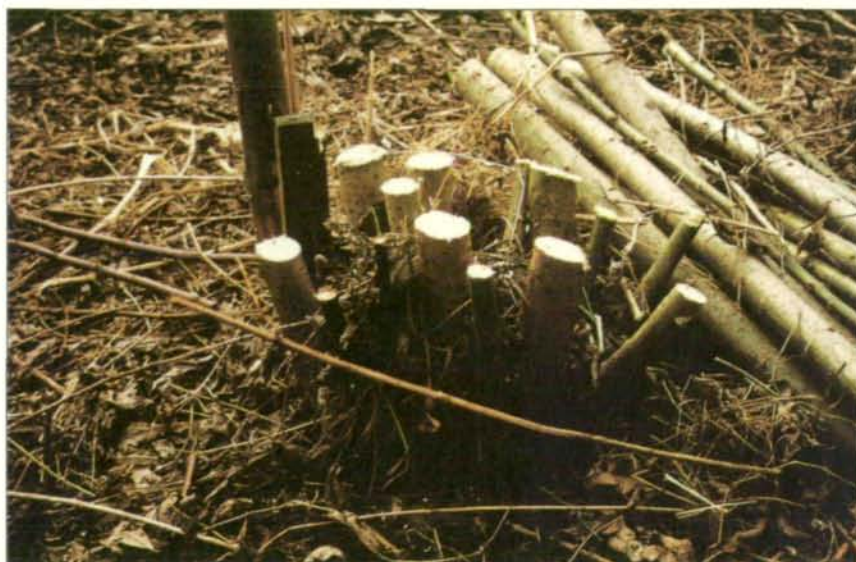
Abb. 3: Energieholzflächen werden nach der Ernte nicht frisch bepflanzt, sondern bilden aus den vorhandenen Stöcken oder Wurzeln neue Triebe.

Ein Ersatz von bereits bestehenden Ökosystemen der Kulturlandschaft (wie Feuchtwiesen oder extensiv genutzte Grünlandflächen) durch künstliche Systeme sollte ausgeschlossen werden. Die Umwandlung von Waldgebieten in Energieplantagen ist ohnehin durch das Forstgesetz untersagt.