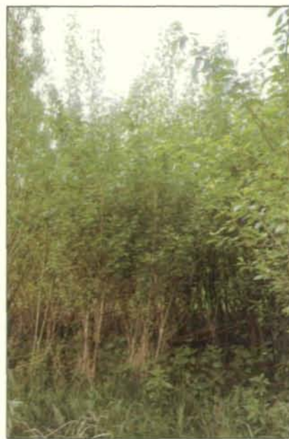
Abb. 6: Energieholzfläche mit Weiden und Pappeln. Die Mischung verschiedener Sorten und die Bodenvegetation erhöhen die ökologische und genetische Vielfalt. Spritzmittel werden damit entbehrlich.

Danach werden Maschinen zur mechanischen Wildkrautbeseitigung (nur im ersten und eventuell zweiten Jahr; zugleich Bodenlockerung) für die Ausbringung von Düngern und Pestiziden eingesetzt. Jeder Maschineneinsatz bewirkt trotz oberflächlicher Bodenauflockerung generell ei-