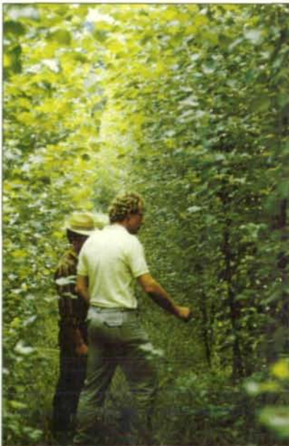
Abb. 1: Pappelfläche im zweiten Jahr. In Oberösterreich werden solche Wuchslösungen ohne Einsatz von Herbiziden oder Pestiziden erreicht.

Ölpreissteigerungen und landwirtschaftliche Produktionsüberschüsse zusammen mit den sich daraus ergebenden Umweltbelastungen führten im letzten Jahrzehnt zur intensiven Suche nach „Alternativen“. Neue Energiequellen, neue Produkte der Landwirtschaft, schonender Umgang mit der Natur waren und sind gefragt. Einer der eingeschlagenen Wege waren die sogenannten „Energiewälder“. Seit nunmehr vier Jahren gibt es solche Anbauversuche auch in Oberösterreich.