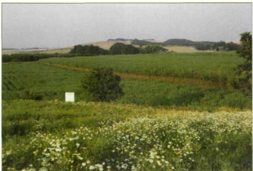
Abb. 2: So sollte es nicht gemacht werden: Weidenanbau in Schweden. Bei nur zweijährigem Umtrieb gleichen die Flächen herkömmlichen landwirtschaftlichen Kulturen.

Für die Auswahl der Baumarten in Energieplantagen ist eher die Produktionsleistung als die Qualität der erzielten Produktion von Bedeutung, wobei aber auch hier ein sogenannter „schnell wachsender Baum“ je nach Versuchsanlage und Autor verschieden definiert ist.