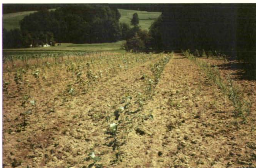
Abb. 4: Energieholzflächen werden nur alle 20 bis 25 Jahre geackert. Dazwischen soll sich der Boden ungestört entwickeln.

Die bekanntesten Baumarten für Kurzumtriebsplantagen sind Pappel, Weide, Erle, Robinie, Platane und Birke, wobei in Österreich vor allem die ersten drei Arten Verwendung finden. Ebenso gibt es Versuche und Ergebnisse von Pflanzungen mit Ahorn, Eberesche, Esche, Edelkastanie, Lärche und zahlreichen bei uns nicht heimischen Arten wie Eukalyptus, Liquidambar, Liriodendron und Nothofagus.