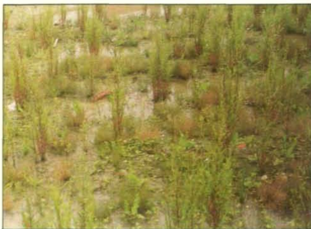
Abb. 10: Das seitliche Gerinne ist schon dicht mit Weiden und Pappeln bewachsen. Auch die Fläche wird von ihnen besiedelt (August 1987).