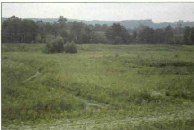
Abb. 9: Die Wiederbesiedlung hat begonnen. Man beachte die andersartige Vegetation beim Schotterabbau: die Belassung von Unebenheiten und Strukturen fördert die Vielfalt von Biototypen (September 1984).

Auch hier sind pflanzensoziologische Zuordnungsversuche (noch) zwecklos; Grünlandpflanzen und solche aus Kalkmagerrasen zusammen mit Ruderalvegetation deuten zur Zeit noch auf keine stabilisierte Pflanzengesellschaft hin.