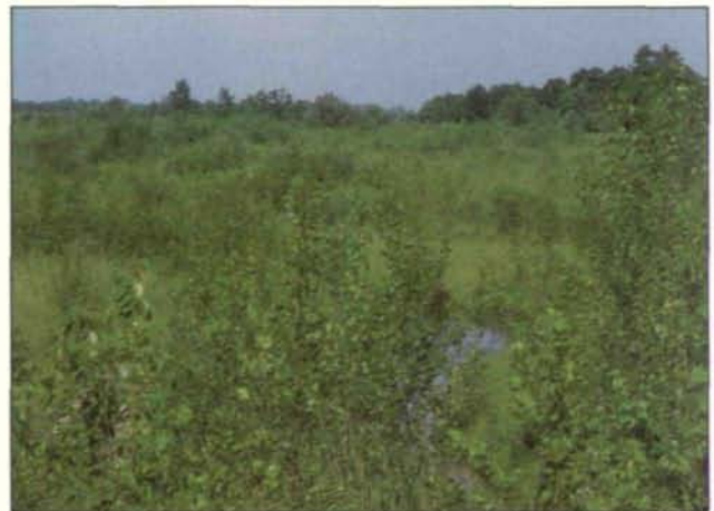
Abb. 7: Der natürlich entstandene Weiden- und Pappelbestand hat sich fast geschlossen. Er dürfte in den nächsten Jahren den Charakter der Vegetation bestimmen (März 1990).

Nach Abschluß der Baumaßnahmen wurde das Gebiet entsprechend einer Auflage aufgeforstet. Die damit betraute Firma hat den Standortfaktoren keinerlei Bedeutung zugemessen und in kleinen Abständen Linden, Eichen, Eschen, Bergahorn und andere Bäume angepflanzt. Von diesen sind die meisten abgestorben oder kümmerlich infolge Wildverbiß und untauglichen Bedingungen dahin; lediglich Pappelhybriden („Kanadapappeln“) und einige Schwarzerlen haben sich durchgesetzt.