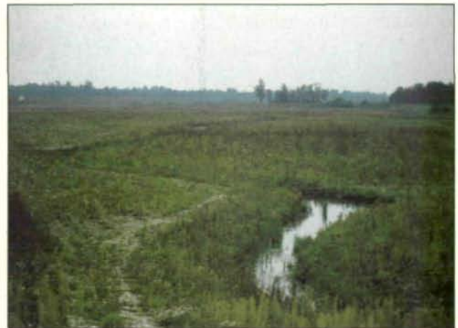
Abb. 5: Beginn der Regeneration durch Samenflug noch im selben Jahr: vorherrschend sind noch Ruderalelemente wie Disteln, aber auch Keimung von Weiden (September 1984).

worden ist. Ein Auftrag von Humus, Sand, Schlamm oder anderem Feinmaterial sei, so die Auskunft, nirgendwo erfolgt.