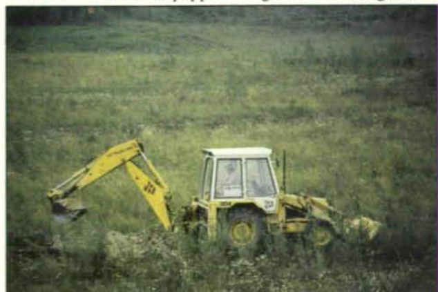
Abb. 14: Durch nachträgliches Ausbaggern von Tümpeln (1986) wurde die korrekte Planierung der Verebnung stellenweise korrigiert. Die Besiedlung durch Rohr und Schilf folgte schon 1987, die Annahme als Amphibienlaichgewässer dagegen örtlich und jährlich ungleichmäßig.

Auch wenn man mit der Pflanzensoziologie nicht absolut exakte Zuordnungen treffen kann, ist doch die Übereinstimmung nennenswert. Sicher aber handelt es sich um Stufen einer Sukzession, denn das Gedeihen des üppigen Weiden- und Schwarzpappelanflugs wird in wenigen Jah-