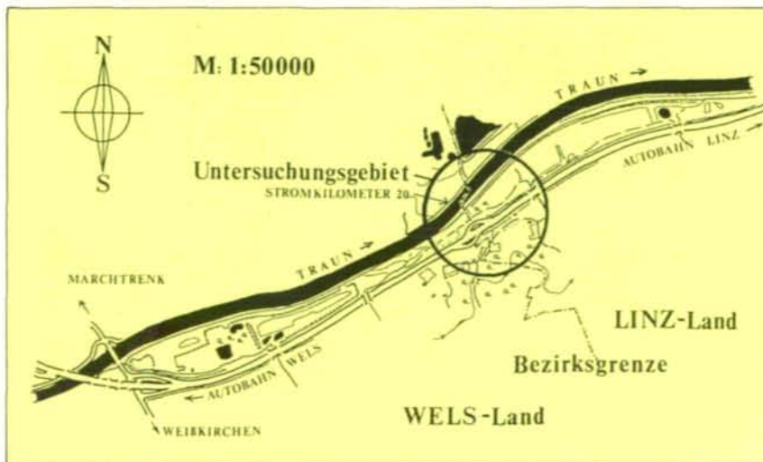
Abb. 2: Die Lage des Untersuchungsgebietes an der Traun.

schnitt gewählt, der vom genannten Stromkilometer 20 bis zu einem be-