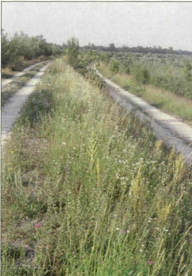
Abb. 11: Die südostgeneigte Dammböschung zeigt Elemente des Trockenrasens, noch durchsetzt von Ruderalpflanzen (u. a. Königskerzen, Berufskraut, Natternkopf). Aufnahme vom 9. Juli 1991. Eine Woche zuvor dominierten Nachtkerze und Natternkopf, vom Weiß des Berufskrauts war noch nichts zu sehen.