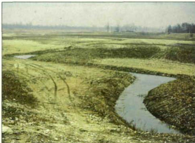
Abb. 4: Das Gelände mit dem mäandrierend angelegten Begleitgerinne am Ende der Baumaßnahmen nach der sehr „ordentlichen“ Planierung (März 1984).