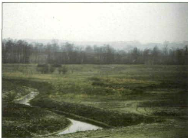
Abb. 8: Das eingeebnete Schotter-Schlier-Gemisch ist noch nackt und zeigt nur geringe Strukturierung, so den Rest eines kleinen Schotterabbaus rechts im Bild (März 1984).

Feuchtigkeitszeiger (7 bis 9) herrschen vor, insbesondere bei den häufig vorkommenden Arten. Das ist zu erwarten: entweder erreichen die Wurzeln den Stauraum oder die an der Folie hochsteigende Feuchtigkeit. Eine pflanzensoziologische Zuordnung ist (noch) nicht möglich; zu unterschiedlich ist die Vegetation, die Elemente aus Gründlandgesellschaften, Kalkmagerrasen, reichen Mischwäldern und sogar Röhricht aufweist.