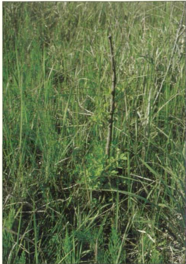
Abb. 12 und 13: Eine Aufforstung ohne Berücksichtigung der vorgegebenen Faktoren (Untergrund, Boden, Tierfraß) hat gegenüber der natürlichen Sukzession nur wenig Chance. (Aufnahme Juli 1991; 12: Eiche und 13: Esche, sieben Jahre zuvor ausgepflanzt. Durch Unangepaßtheit gegenüber der gegebenen Örtlichkeit und durch Wildverbiß kaum 20 cm hoch.).

Wechselnassen Zwergpflanzenflur (Cyperetalia) wie Cyperus flavus oder Juncus bufonius , und der Flut- und Feuchtpionierassen (Agrostietalia), so Mentha longifolia und Pulicaria dysenterica , durchsetzt.