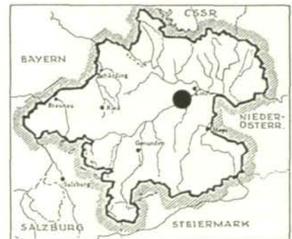
Abb. 1: Lage des Untersuchungsgebietes in Oberösterreich.

nachbarten Autobahnparkplatz (Abb. 2) reicht.