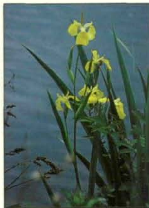
Abb. 15: Das angelegte Begleitgerinne konnte sich wegen der mäandrierenden Führung und durch den Einbau von Weitungen und Schwellen naturnah entwickeln (15: Flutender Wasserhahnenfuß, 16: Schwertlilie). Mai 1990.