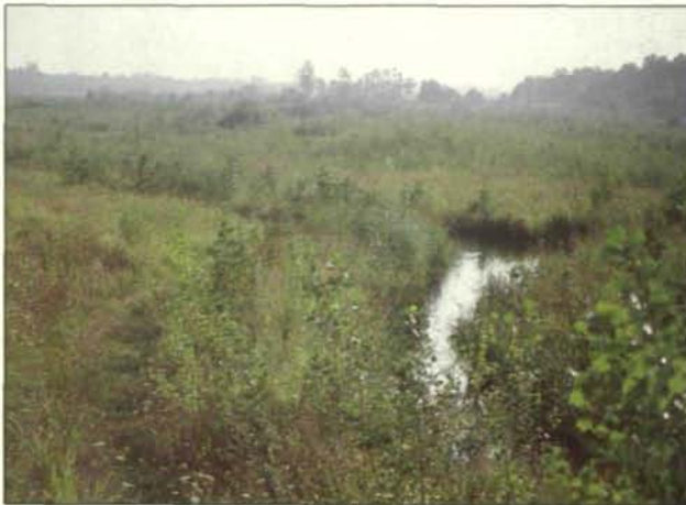
Abb. 6: Die Vegetation macht den Eindruck eines Buschwaldes. Weiden und Pappeln beginnen zu dominieren. Von den gepflanzten Bäumen setzen sich nur Pappelhybriden („Kanadapappeln“, rechts im Bild) und Schwarzerlen durch (August 1987).

Den nachfolgenden Pflanzenlisten wurden Zeigerwerte für Licht (L),