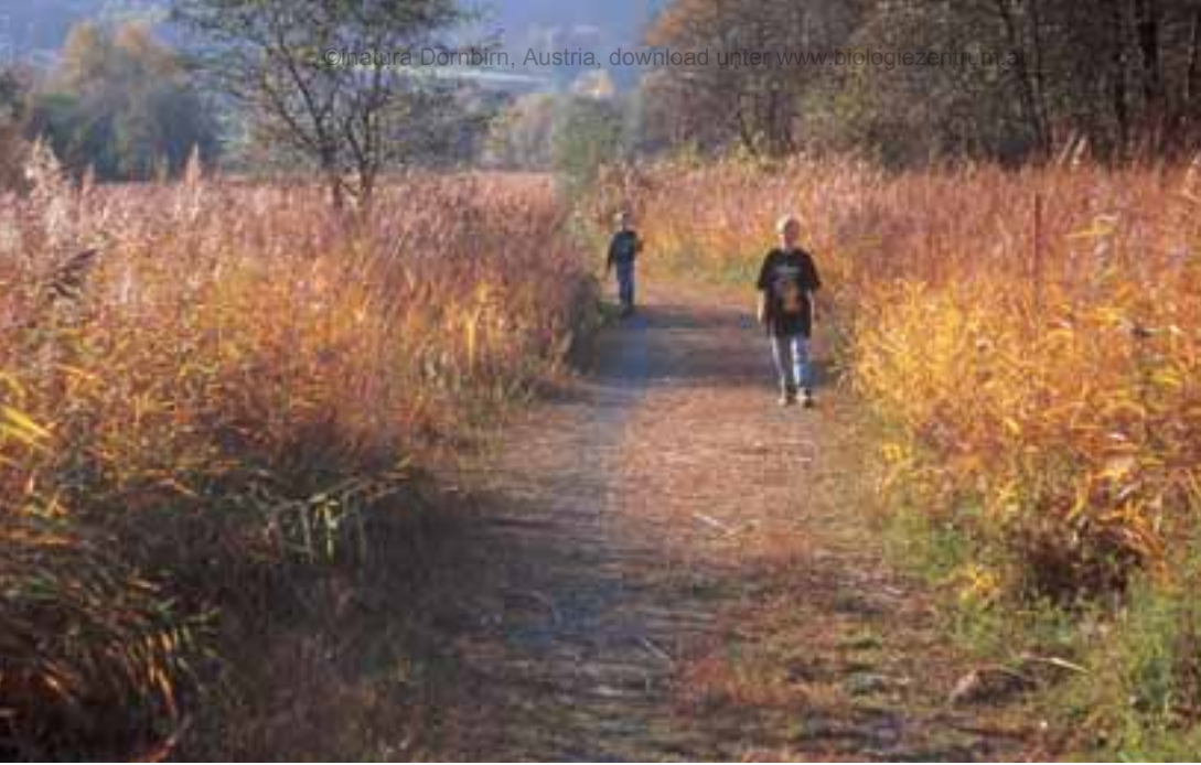
Erlebnisbühne Ried. Raum für Erholung, Entdeckung und Forschung