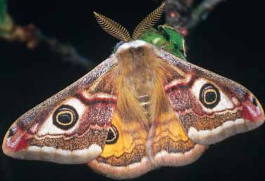
Nachtpfauenaug ( Saturnia pavonia )

Es handelt sich um das typische Artenspektrum eines Flachmoor-komplexes: Arten, die ausschließlich hier vorkommen oder die zumindest Feuchtlebensräume bevorzugen, deren Larven in den Halmen des Schilfes oder in den Kätzchen der Salweide leben, die in den Laubblättern der Heckenkirsche minieren oder von den Samenanlagen in den Fruchtknoten des Sumpfstorchschnabels leben oder gar als Gäste in den Staaten von Rasenameisen. Daneben stellen die Arten mit geringerer oder keiner speziellen Bindung an das gegenständliche Ökosystem das Gros. Vergleiche hierzu den Beitrag von Eyjolf AISTLEITNER & Ulrich AISTLEITNER auf den Seiten 329-360.