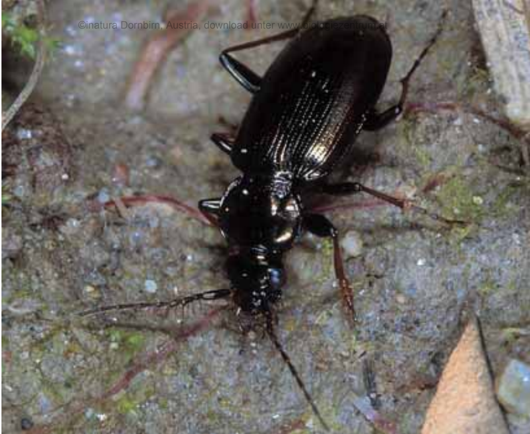
Loricera pilicornis – Borstenhornläufer