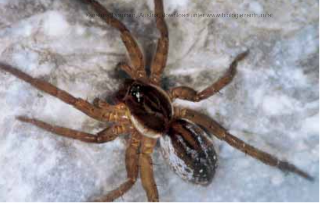
Pirata piraticus eine Spinnenart des Frastanzer Riedes