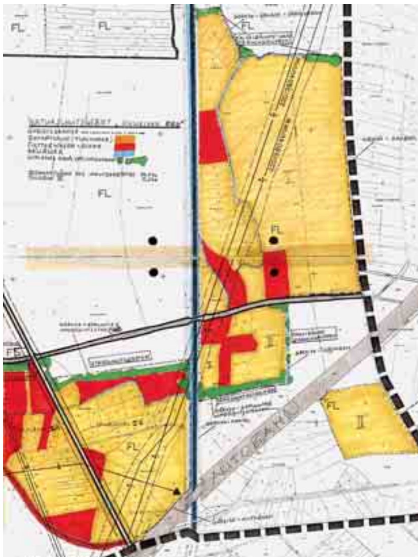
Abb. 2: Planausschnitt der ersten Schutzgebietsabgrenzung im Jahre 1986