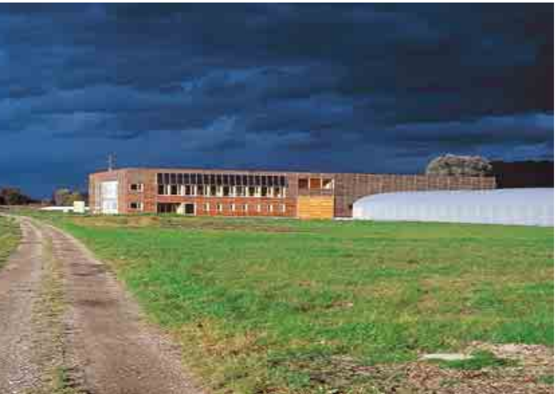
Abb. 5: Der neue Vetterhof nördlich des Gsieg

Standortkompromiß Vetterhof: Dank der Bereitschaft der Familie VETTER, der Initiative der Gemeinde Lustenau und der Umweltabteilung der Vbg. Landesregierung kann mit finanzieller Unterstützung des Landschaftspflegefonds ein vom Naturschutzgebiet weitestmöglich entfernter Standort für den Hofneubau erreicht werden.