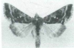
Abb. 2. Autographa pulchrina

stärker auf, sondern er tritt auch im hinteren, unteren Teil des Mittelfeldes ziemlich stark auf. Bei pulchrina ist hier meist nur ein kleiner ocker- oder rostfarbener Flecken vorhanden, der äußerst selten einen schwachen metallischen Glanz zeigt. Bei 7 der mir vorliegenden 12 Plusia var. buraetica ist das silberne Doppelzeichen vollständig in ein Gamma zusammengeflossen, was bekanntlich bei pulchrina sehr selten vorkommt".